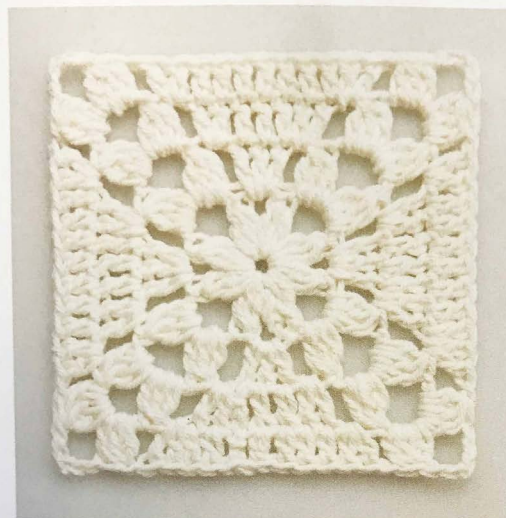
Haak rd volgens het telpatroon. Haak rd 1-4 1 x.